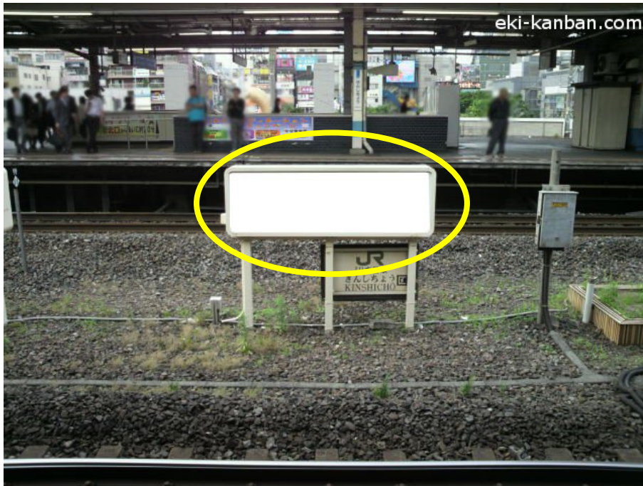
※媒体写真(両面仕様)