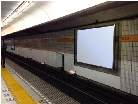
※掲出イメージです。

●申込（2015/8月～10月掲出分）：2015/6/29 10：00～随時受付開始